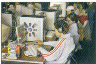
Goed zicht op het moederbord.